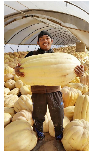
แรงงานไทยกำลังคัดคุณภาพฟักทองที่เพิ่งเก็บเกี่ยวจากฟาร์มในประเทศอิสราเอล

กลุ่มผู้ได้รับผลประโยชน์: แรงงานไทยในภาคเกษตรของประเทศอิสราเอล นายจ้างอิสราเอลในภาคการเกษตร