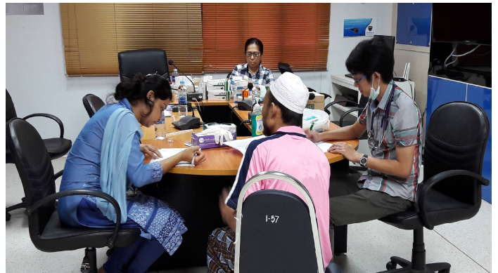
เจ้าหน้าที่ IOMกำลังตรวจประเมินสุขภาพในจังหวัดพังงา พ.ศ. 2559

กลุ่มเป้าหมาย : ผู้ย้ายถิ่นชาวมุสลิมจากรัฐเมียนมาร์และกลุ่มเสี่ยงพิเศษอื่น ตลอดจนผู้อพยพชาวบังคลาเทศที่ถูกกักกันชั่วคราวในประเทศไทย