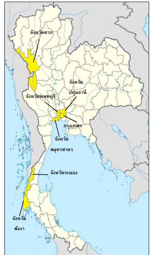
จังหวัดในประเทศไทยที่มีกิจกรรมต่อต้านการค้ามนุษย์ของไอโอเอ็ม

เพื่อสนับสนุนเสรีภาพและโอกาสในการเริ่มชีวิตใหม่ของผู้เสียหายฯ ไอโอเอ็มสนับสนุนการให้ความช่วยเหลือโดยตรงแก่ผู้เสียหายจากการค้ามนุษย์ ได้แก่ ที่พักอาศัยที่ปลอดภัย บริการทางการแพทย์ และการสนับสนุนด้านจิตสังคม รวมถึงสนับสนุนการเดินทางกลับประเทศต้นทางโดยสมัครใจ และการกลับคืนสู่สังคมของผู้ย้ายถิ่น ไอโอเอ็ม สนับสนุนความช่วยเหลืออย่างครอบคลุมให้กับผู้เสียหายจากการค้ามนุษย์ที่อยู่ในความคุ้มครองของบ้านพักเด็กและครอบครัว และสถานคุ้มครองสวัสดิภาพผู้เสียหายจากการค้ามนุษย์ทั่วประเทศไทย